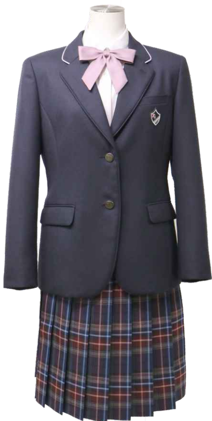
オプションスカート Winter