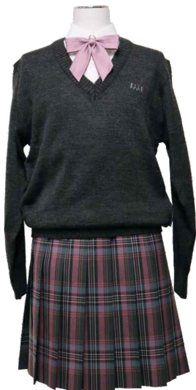
冬セーター（グレー） Winter