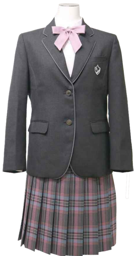
オプションスカート Winter