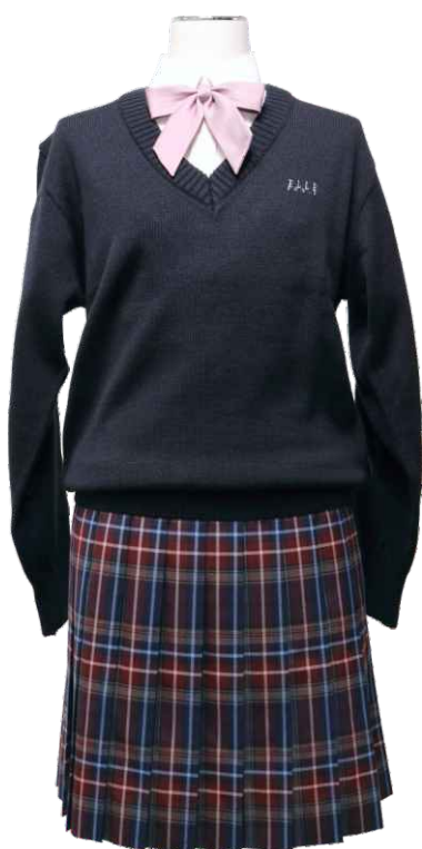
冬セーター (紺色) Winter