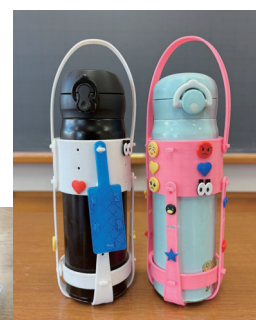
↑ 3期生実績 ペットボトルケース