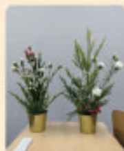
部活でいけたお花