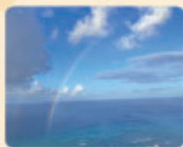
海外研修で参加したハワイ。 虹がとてもきれいでした。