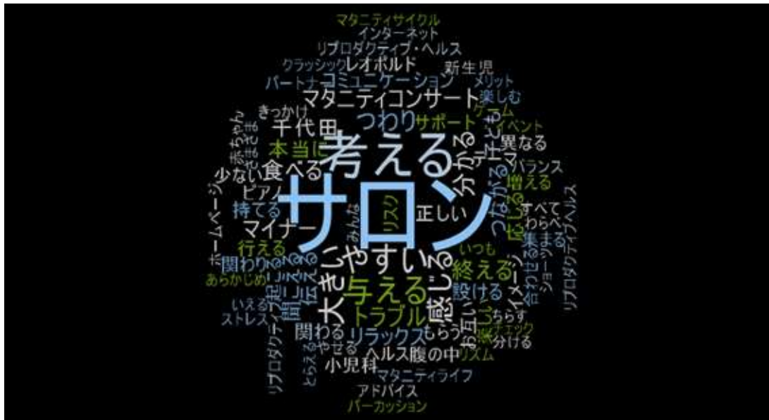
図 2 頻出語による単語クラウド