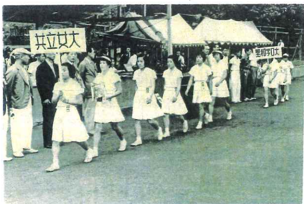
昭和29年 東日本選手権大会開会式（上田市）

その会場で出会ったのが中央大学の学生だった主人でした。そして、卒業の1年後、謝恩会の会場だった赤坂プリンスホテルで挙式、間もなく54年になります。