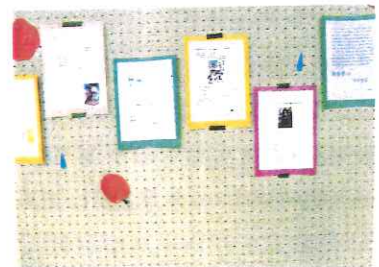
共立祭での書評の展示